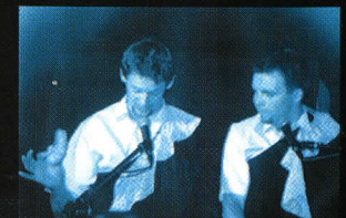
Kabaret ANI MRU MRU